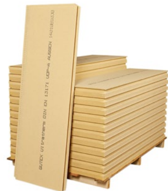
GUTEX Multiplex-top, GUTEX Ultratherm und GUTEX Multitherm

Sie haben die Wahl zwischen den regensicheren Unterdeckplatten GUTEX Multiplex-top oder GUTEX Ultratherm und der hydrophobierten, feuchteabweisenden Dämmplatte GUTEX Multitherm. Die Unterdeckplatten sind aufgrund der höheren Rohdichte etwas robuster. Die etwas weichere GUTEX Multitherm erleichtert mit der herkömmlichen Profilierung die Herstellung einer glatten Oberfläche. Zudem hat sie hervorragende Dämmeigenschaften: Wärmeleitfähigkeit Nennwert \lambda_D = 0,040 \text{ W/mK} , Wärmeleitfähigkeit Bemessungswert \lambda = 0,042 .